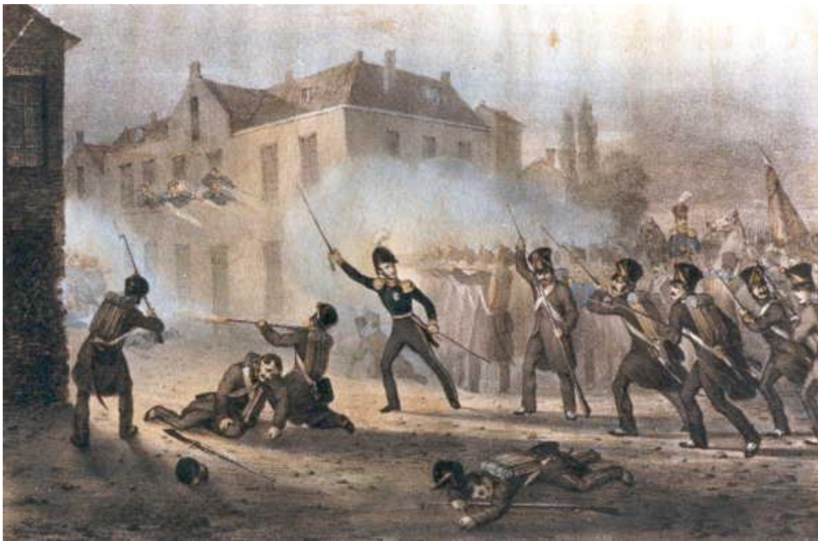
Prins Willem leidt de strijd in Ravels op 2 augustus 1831

Op 10 en 11 augustus trekken de drie divisies elk volgens de hen toebedeelde taak naar Leuven. Op verschillende plaatsen stuiten ze daarbij op verzet en moeten de Nederlandse troepen zich met schermselingen een weg banen.