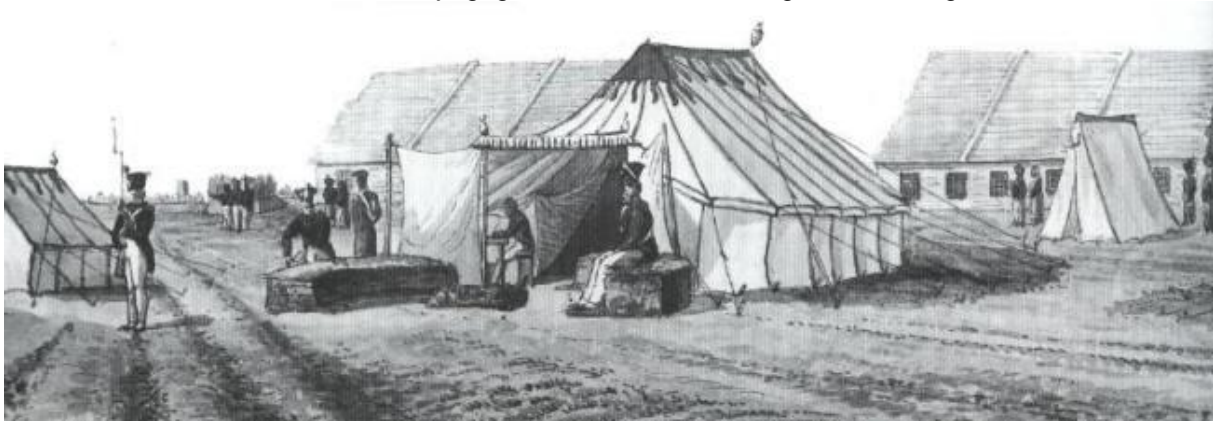
Kampement in Rijen

Ze krijgen, zoals alle deelnemers aan de veldtocht, het ijzeren kruis van verdienste opgespeld als teken van betoonde moed. Deze kruizen zijn gegoten uit 3 van de 5 buitgemaakte Belgische kanonnen.