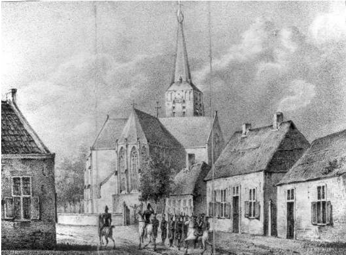
Doortocht door Poppel

De vijfde augustus levert evenmin grote problemen op. De Eerste Divisie trekt naar Geel, waar de Tweede juist opbreekt om Diest te bezetten. De Derde Divisie rukt na lichte gevechten bij Oostham, op naar Beringen, ten Noordoosten van Diest. Door het bezetten van deze twee plaatsen, Diest en Beringen, is aan het eerste doel voldaan omdat de twee Belgische legers blijven volharden in hun afwach- tende, statische houding. Daardoor hebben ze de kans voorbij laten gaan om gezamenlijk het moeras- sige gebied van Dijk en Demer te verdedigen. 6 augustus is een rustdag.